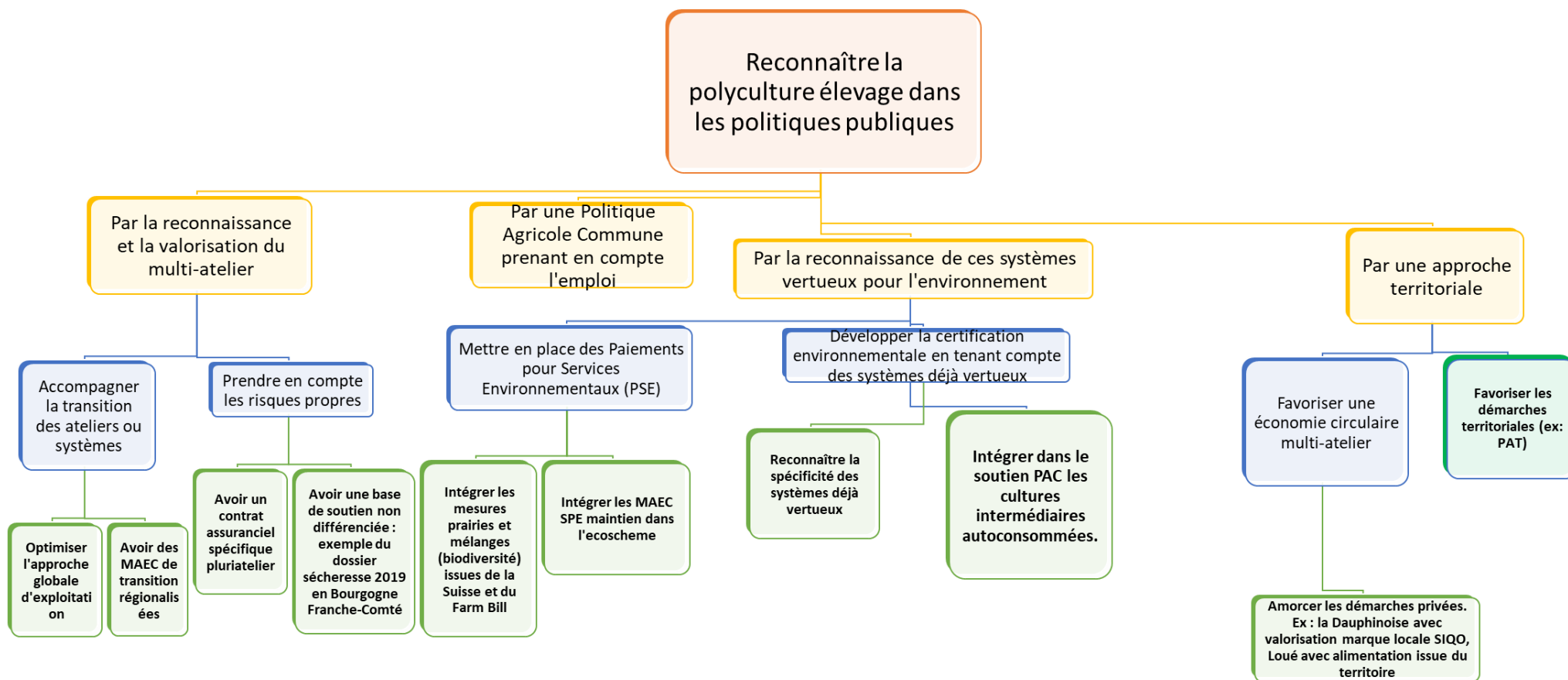
Figure 2 : Rôle des politiques publiques dans l'accompagnement des systèmes de polyculture élevage

Les politiques publiques peuvent favoriser la polyculture élevage, système au cœur de la démarche agroécologique (cf. résultats de Cantogether), à condition de mettre en place des mesures adaptées à ces pluri-ateliers telles qu'un dispositif assurantiel ad hoc, le développement de soutiens existants par ailleurs (Suisse, USA), l'intégration des MAEC maintien SPE 2 dans le futur ecoscheme 3 , le maintien des prairies et pâturages permanents et l'accompagnement des démarches territoriales d'accompagnement de démarches d'intégration culture-élevage à l'échelle d'une exploitation mixte multi-ateliers ou entre exploitations spécialisées culture et élevage à l'échelle du territoire. (cf. figure 2 ci-après).