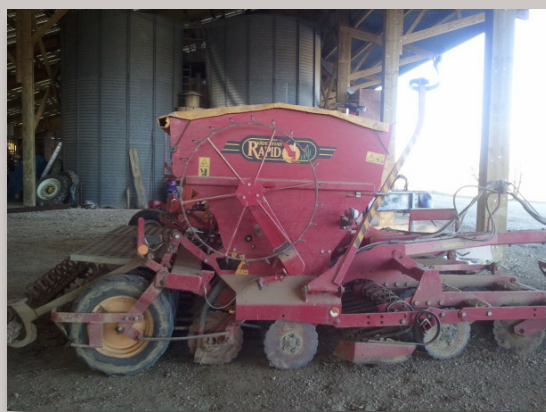
Le Väderstad rapid 3m