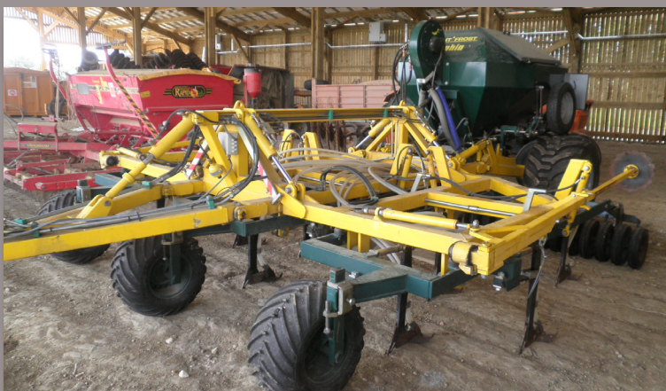
Le semoir tonutti de 4,5 m.

Pas de couverts végétaux en interculture jusqu'à 2010. Je souhaite maintenant implanter des couverts avant le tournesol, pour protéger le sol durant l'interculture longue.