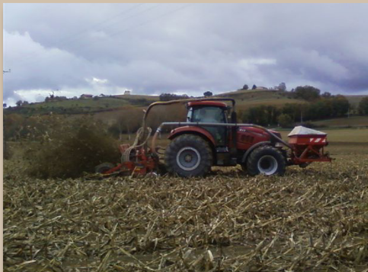
Semis de blé en direct après un maïs grain avec le Horsch Sème Exact.

Je ne fais pas de désherbage avant le semis du blé : les parcelles sont propres et le Sème-Exact permet un bon désherbage mécanique.