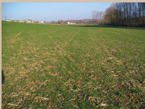
Levée du blé tendre (précédent maïs grain)