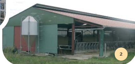
Vue du côté Ouest du bâtiment semi-ouvert. Silo à tourteau de soja.