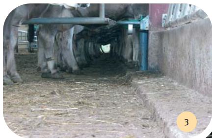
Caillebotis et la petite marche anti-recul de 0,40 m au pied du cornadis pour éviter les souillures de l'auge et augmenter l'aire d'exercice.

La ventilation du bâtiment semi-ouvert est assurée par une ouverture de 20 cm dans la faîtière et les tôles perforées en pignon et sur le long-pan arrière (photo 2).