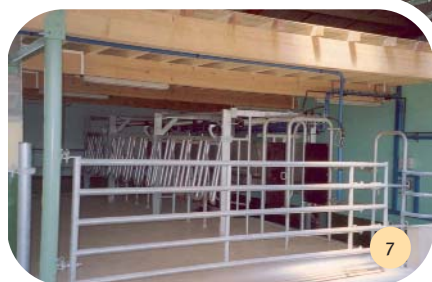
Salle de traite à 11 places en traite par l'arrière (TPA).