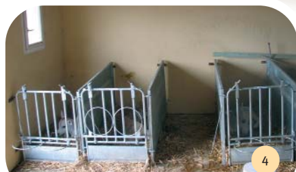
Les box à veaux sont situés dans une pièce du secteur laiterie. Cette pièce a un accès vers l'intérieur et l'extérieur.