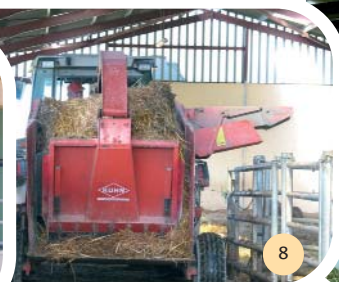
Pailleuse en action. Moment quotidien "délicat" car il faudrait 0,50 m de plus de largeur pour passer facilement entre les vaches et les barrières.