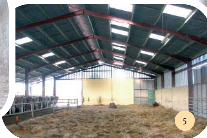
Vue de l'aire paillée de 10 m de large et 42 m de long.