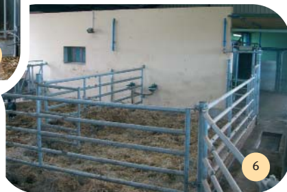
Parcs de vêlage - IA et isolement contre le mur de la salle de traite : abreuvoirs, lumière, possibilité de branchement d'un pot à traire pour une vache isolée. Pédiluve dans le couloir de sortie de la salle de traite.