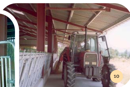
La distribution de l'ensilage de maïs au cornadis est mécanisée. Les balles rondes de foin sont déposées devant le cornadis et réparties à la main. Les concentrés sont distribués manuellement au cornadis.

Les abreuvoirs automatiques sont des bols individuels installés sur les poteaux supports du cornadis.