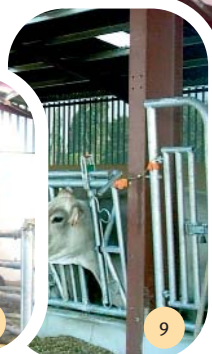
Passage d'homme = 1 place au cornadis