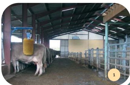
Le couloir d'exercice en caillebotis de 4 m. Photo prise dans le secteur de l'aire d'attente. La salle de traite est sur la droite.