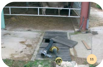
Accès à la fosse pour le mixage régulier et le pompage du lisier.

A noter : le caillebotis est de type renforcé, supportant une charge à l'essieu de 6 T.