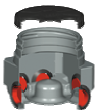
Ex- regard répartition

Astuce Fumière à compost : Préférez un transport de la cuve de récupération par un chargeur.