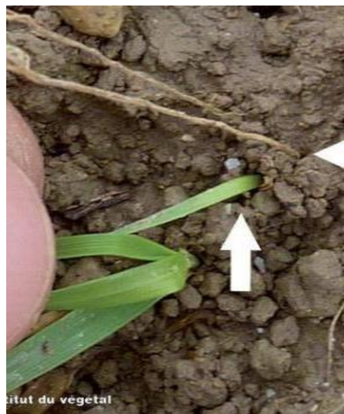
Figure 2 : dégâts de Zabre : feuille qui est entraînée dans la galerie de la larve