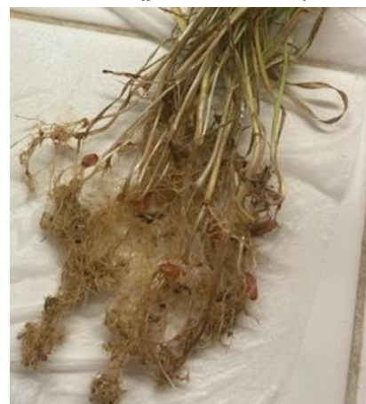
Figure 6 : racines de blé avec attaque de nématodes

La présence de nématodes sur une parcelle est à prendre au sérieux et nécessite des actions sur le