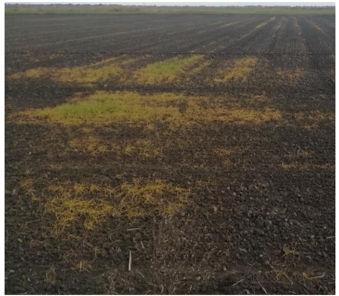
Figure 7 : blés dur détruits par le sel en Camargue (parcelle analysée avec résultat positif à un problème de sel)

Des analyses sont réalisées : sur 8 parcelles analysées dans différents secteurs, 5 ressortent problématiques en sel.